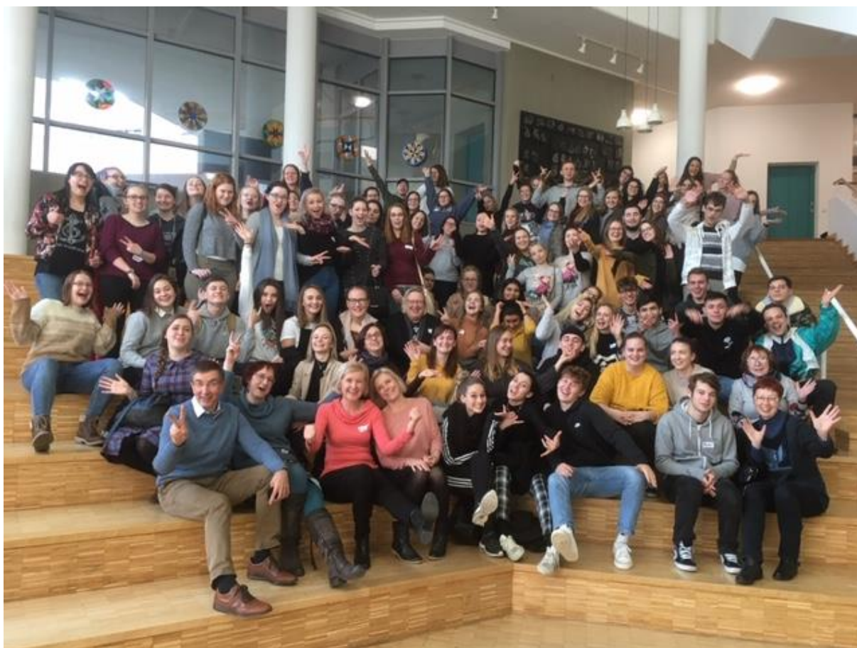
Naši žáci spolu se studenty EA VOŠ na návštěvě partnerské školy ve Stuttgartu

Dlouhodobá plodná spolupráce našich škol byla jmenovitě velmi pozitivně oceněna samotným primátorem města Stuttgart na slavnostním galavečeru, který byl pořádán k 30. výročí spolupráce partnerských měst Brna a Stuttgart. Ředitelka naší školy byla součástí oficiální delegace města Brna, která u této příležitosti Stuttgart v říjnu 2019 navštívila.