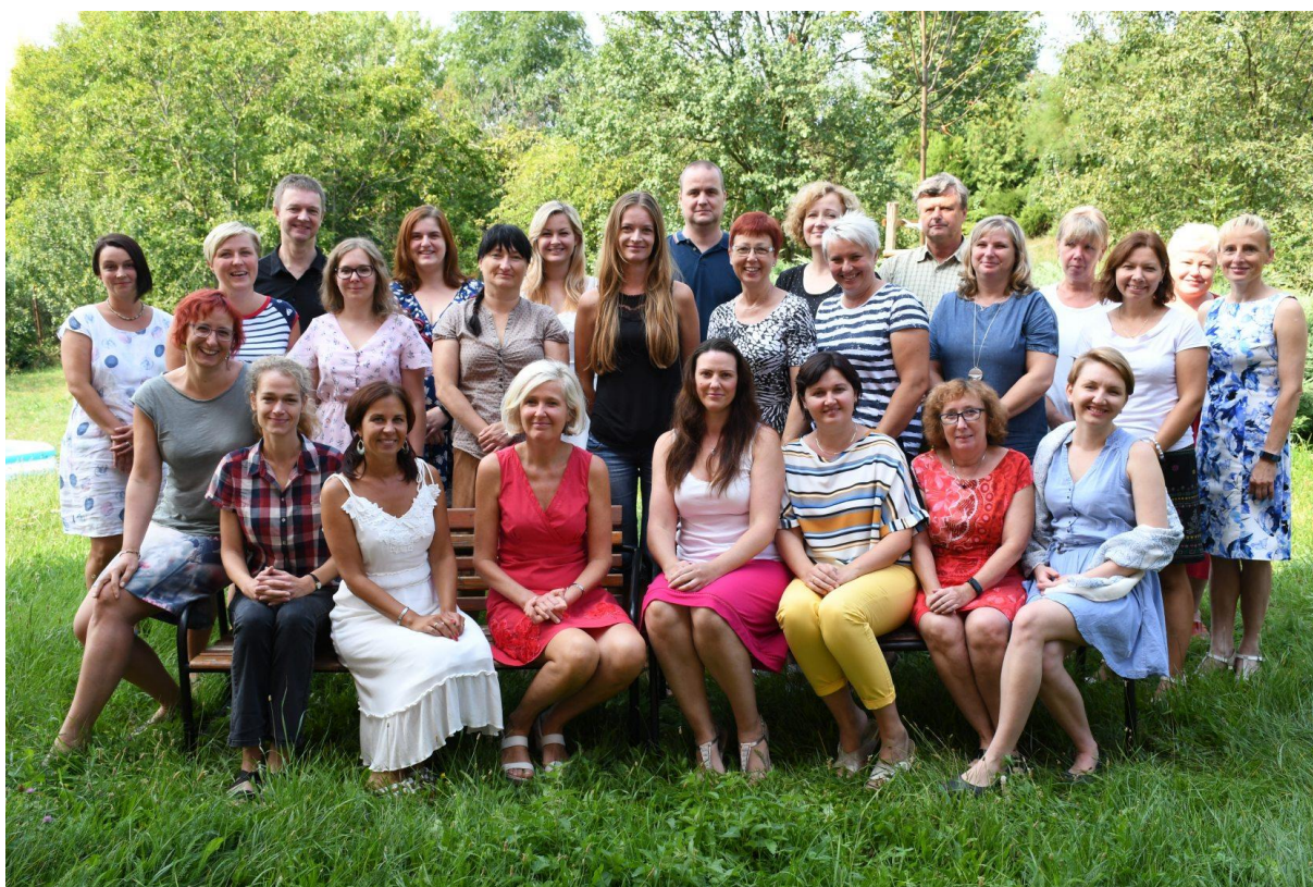
Naši vyučující ve školním roce 2019/2020